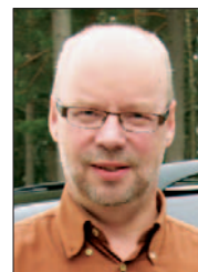
Kari Korpi Korpikorpi Pikakuivaus Oy

Korpikorpi Pikakuivaus Oy on kuivausalan palveluyritys palkittiin kiinteistöjen kosteusvaurioiden korjaamiseen kehitetystä pikakuivausmenetelmästä ja siihen pohjautuvasta palvelukonseptista. Kuivatettavat tilat saadaan menetelmän avulla nopeasti ja energiaa säästään takaisin käyttöön.